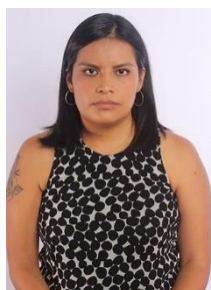
DIP. ALEJANDRA MÉNDEZ VICUÑA INTEGRANTE