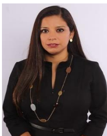
DIP. LUISA ADRIANA GUTIÉRREZ UREÑA INTEGRANTE