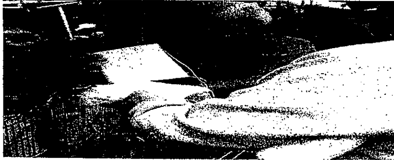
Fig. 2.-En calles, tianguis y mercados, donación de cubrebocas

DIRECCIÓN GENERAL DE DESARROLLO SOCIAL DIRECCIÓN DE SALUD