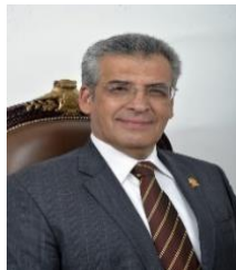
INTEGRANTE DIP. JESÚS RICARDO FUENTES GÓMEZ