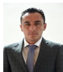
INTEGRANTE DIP. MIGUEL ÁNGEL ÁLVAREZ MELO