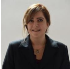
INTEGRANTE DIP. MARÍA GABRIELA SALIDO MAGOS