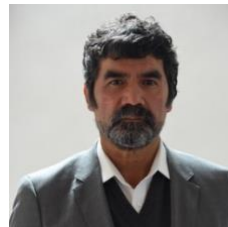
INTEGRANTE DIP. EFRAÍN MORALES SÁNCHEZ