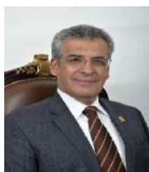
INTEGRANTE DIP. JESÚS RICARDO FUENTES GÓMEZ