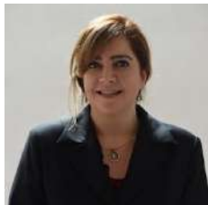
INTEGRANTE DIP. MARÍA GABRIELA SALIDO MAGOS