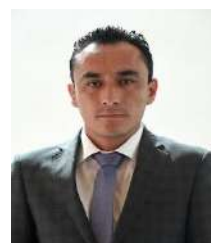
INTEGRANTE DIP. MIGUEL ÁNGEL ÁLVAREZ MELO