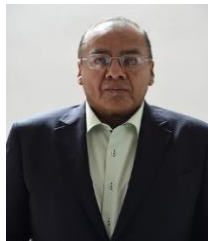
INTEGRANTE DIP. NAZARIO NORBERTO SÁNCHEZ