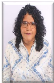
DIP. INDALÍ PARDILLO CADENA VICEPRESIDENTA