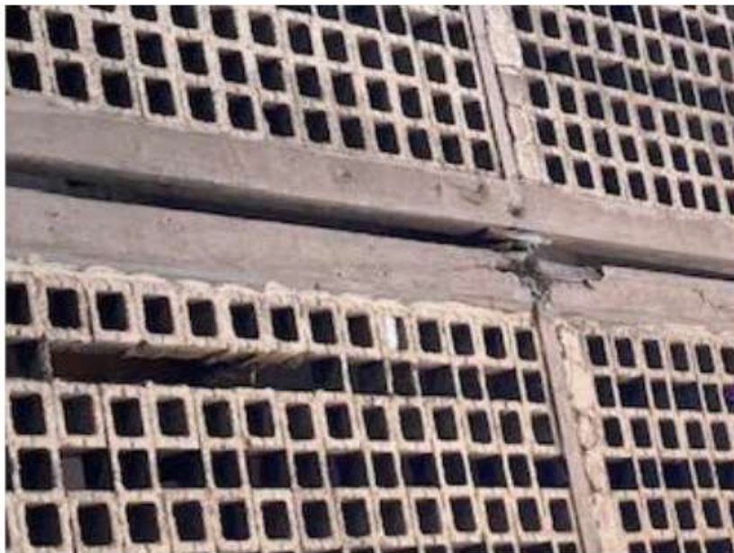
HIDALGO 39 EDIFICIO F