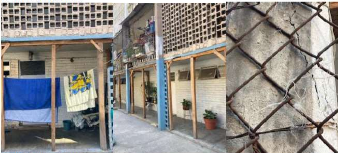
HIDALGO 39 EDIFICIO F