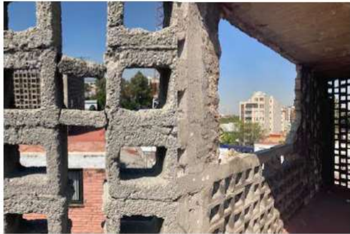
AZOTEA HIDALGO 39 EDIFICIO F